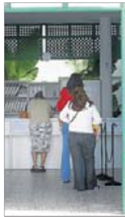
Centro. Usuarios en un mostrador.

Agrega que los niños serían los únicos usuarios sin «médico de cabecera fijo». La asociación médica apunta que para entender porque se ha llegado a esta situación, hay que tomar en cuenta varios factores entre ellos la escasez de especialistas en pediatría.