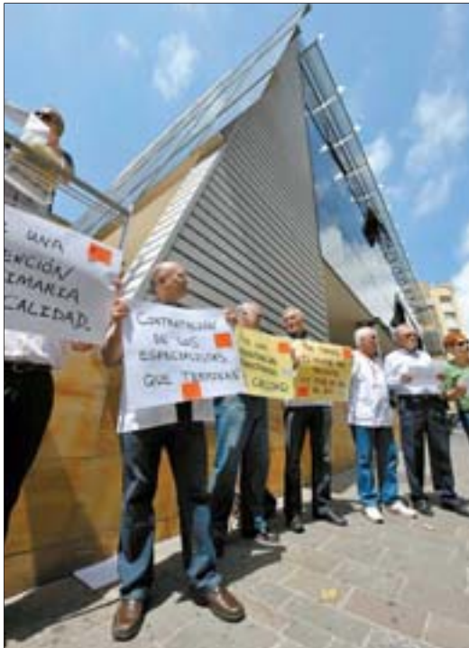
UNA PROTESTA DE LOS MÉDICOS de Tenerife, en una foto de archivo.

Como en otras protestas anteriores, médicos y enfermeros que van juntos a la huelga bajo las siglas CEM-SATSE, se encuentran con unos servicios mínimos “de casi el cien por cien”. “Ni si quiera es como un día de guardia”, se quejó.