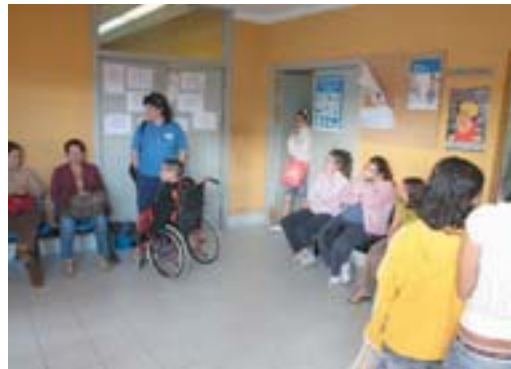
Pacientes en el Centro de Salud de Puerto del Rosario.

No obstante, los sindicatos ya han denunciado el uso “abusivo” que realiza la Consejería de Sanidad de los servicios mínimos cada vez que se convoca un conflicto laboral en el Servicio Canario de Salud. Los convocantes de la huelga en el sector sanitario denuncian que la Consejería imponga servicios del 100% de la plantilla en plantas hospi-